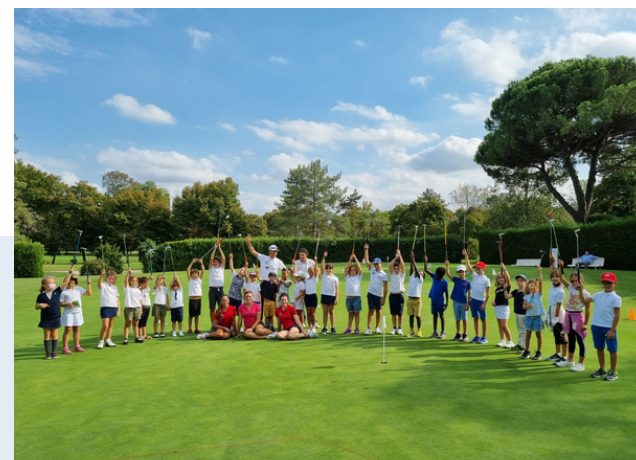
Junior Class 2023