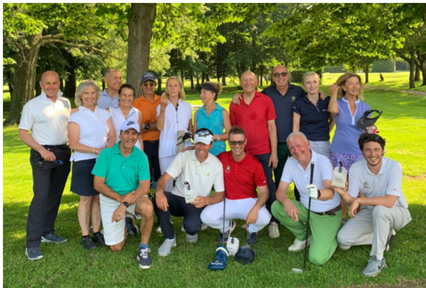
Senior Class 2023

L'Academy del Golf Club Padova organizza corsi di golf per neofiti, ragazzi dai 6 ai 21 anni, Seniores, Atleti Agonisti e giocatori di ogni livello. Durante il mese di giugno si tengono i centri estivi per ragazzi.